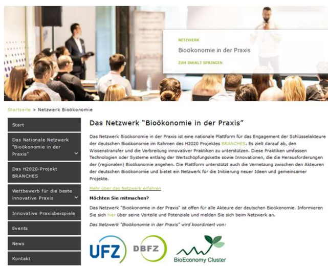
Obrazek: Webové stránky sítě „Bioekonomika v praxi“ ( https://www.dbfz.de/netzwerk-biooekonomie )

Klíčová slova: cirkulární bioekonomika, quadruple helix, inovace, spolupráce, přenos znalostí.