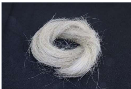
Obrázek: Lněná vlákna z uzavřeného anaerobního máčení

Klíčová slova: vlákna, organické kyseliny, bioplyn, biometan, máčení.