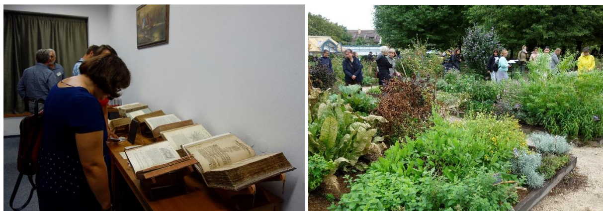
Obr. 5: Petr Bílek doplnil svoji přednášku o nejdůležitějších vydáních Mattioliho herbáře ukázkami ze své soukromé sbírky