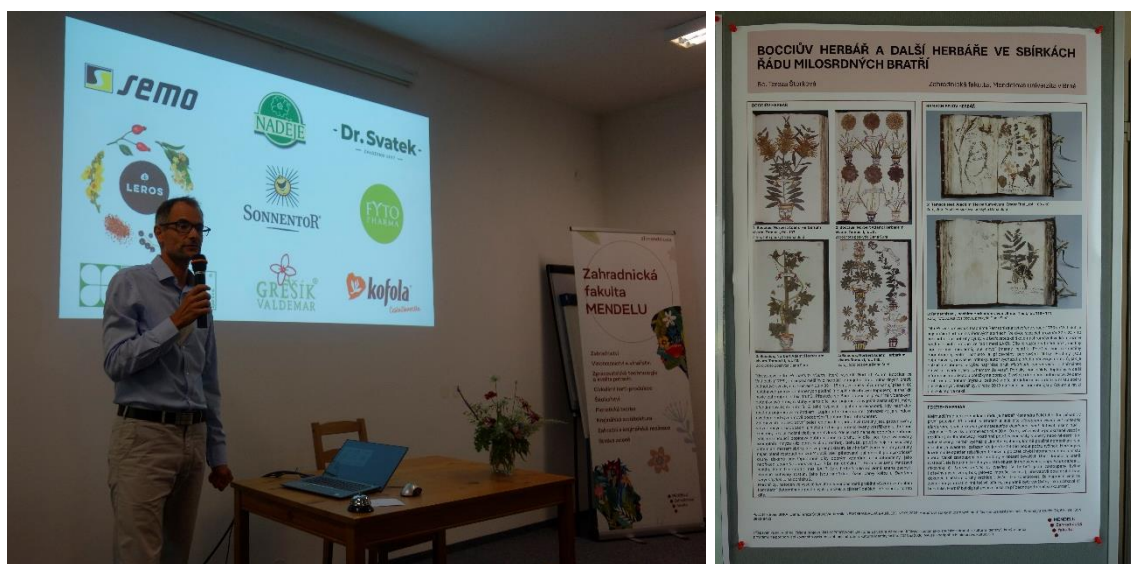
Obr. 3: Tomáš Kopta děkuje MK ČR jako poskytovateli finančních zdrojů projektu a sponzorům, kteří podpořili uspořádání konference